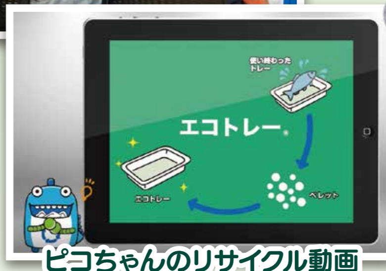
ピコちゃんのリサイクル動画